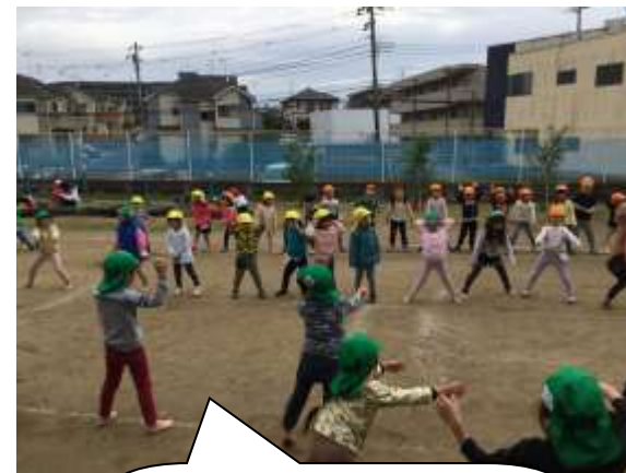
翌日みんなでソーラン節